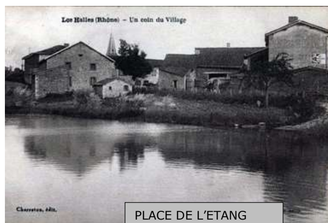
PLACE DE L'ETANG