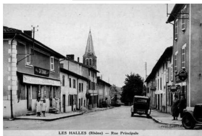
LES HALLES (Rhône) — Rue Principale