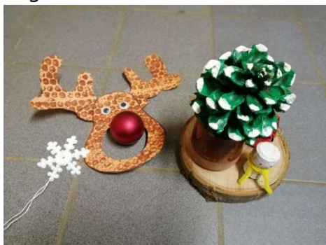
Décor Noël réalisés par les élèves

En fonction de l'évolution du contexte sanitaire, des sorties seront organisées sur la fin de l'année scolaire. Une classe de découverte est en projet pour la classe de CE-CM (Châteaux de la Loire et Futuroscope). Afin de financer les différentes sorties ou activités, l'ensemble des élèves a fabriqué de petits objets qui ont été vendus sous forme de commandes (le traditionnel marché de Noël n'ayant pas pu avoir lieu). Une vente de galette a aussi été organisée avec l'Association du Restaurant d'Enfants en ce début d'année.