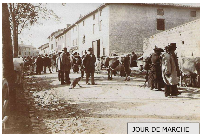
JOUR DE MARCHÉ