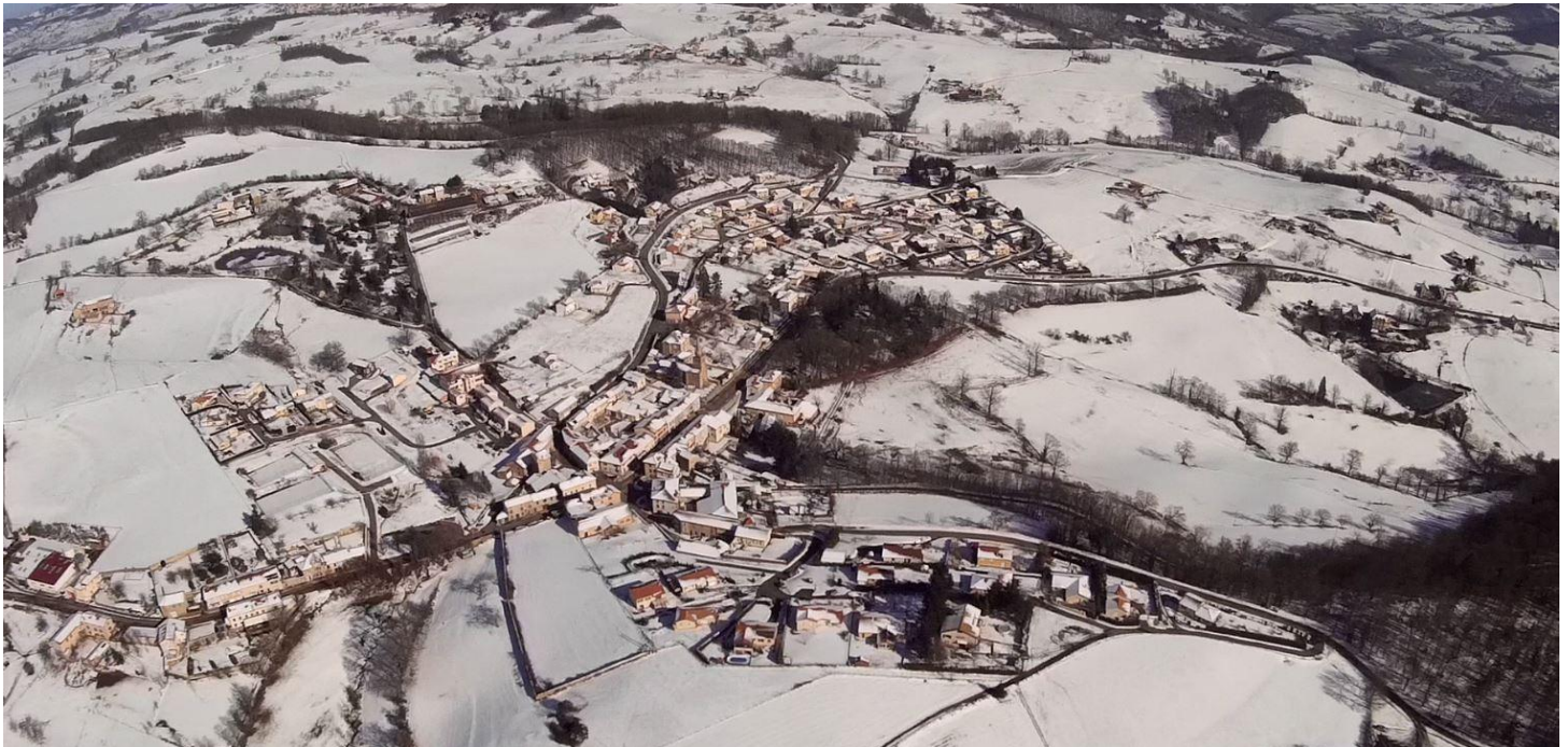
Les Halles « vue du Ciel » sous la neige